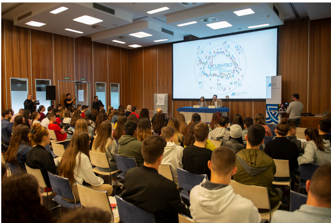
Inauguración del II Encuentro de jóvenes por la igualdad.

Lugar: Hotel Parador Atlántico, Avenida Doctor Gómez Ulla, 1, Cádiz.