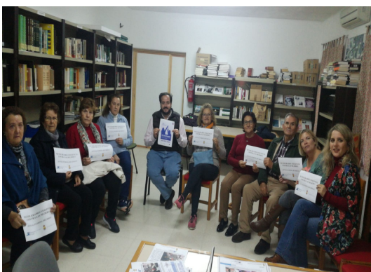
Acto en Estella del Marqués.