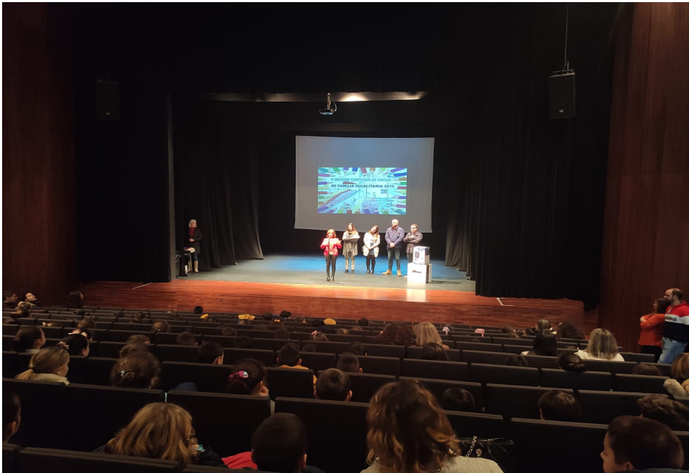
Momento del acto de entrega de premios en un centro educativo, presidido por la Diputada del Área de Igualdad, Carmen Collado Jiménez.