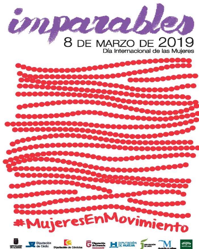
Cartel de la campaña.

Objetivo general: sensibilizar en materia de igualdad entre mujeres y hombres a la población de la provincia.