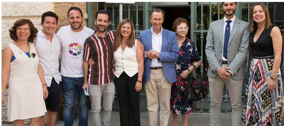
Momento del acto con la asociación Delta.

Se regula mediante convenio la colaboración con las siguientes entidades: