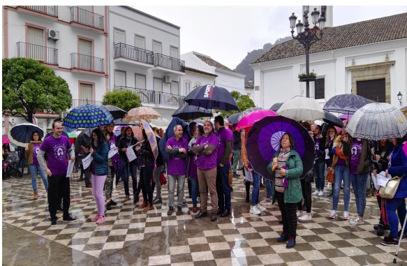
Concentración en Ubrique.

Contenido del acto: el mismo día, y a la misma hora, representantes políticos y de la sociedad civil de cada entidad local se unen para difundir el siguiente mensaje consensuado con el Área de Igualdad de la Diputación de Cádiz: "La provincia de Cádiz unida por la Igualdad". Se hacen fotos y se cuelgan en las redes sociales con el hashtag #ImparablesCadizprovincia#