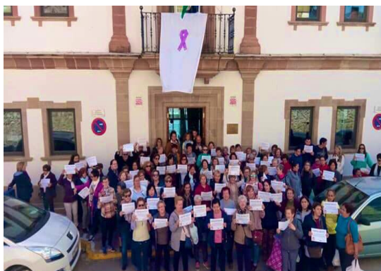
Concentración en Algodonales.