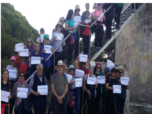
Concentración en El Torno.