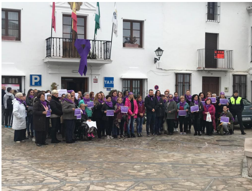
Concentración en Zahara de la Sierra.

Contenido del acto: el mismo día, y a la misma hora, representantes políticos y de la sociedad civil de cada entidad local se unen para difundir el siguiente mensaje consensuado con el Área de Igualdad de la Diputación de Cádiz: "No toleramos violencia contra las mujeres. Juntas, fuertes, decididas". Se hacen fotos y se cuelgan en las redes sociales con los siguientes hashtags: #NotoleramosVG, #25Nprovinciacadiz, #Niunamenos y #Vivasnosqueremos.