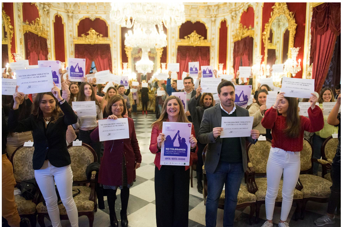
Momento del acto institucional de entrega de premios presidido por la Presidenta de la Diputación de Cádiz, Irene García Macías.

Acto institucional de entrega de premios: 25 de noviembre de 2019.