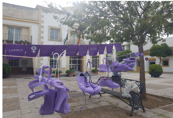
Detalle de la concentración en Guadalcazín.