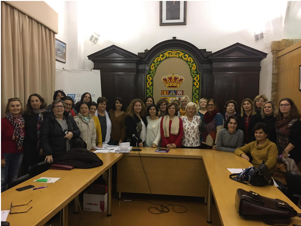
Reunión del Consejo Provincial de Igualdad del 23 de octubre.