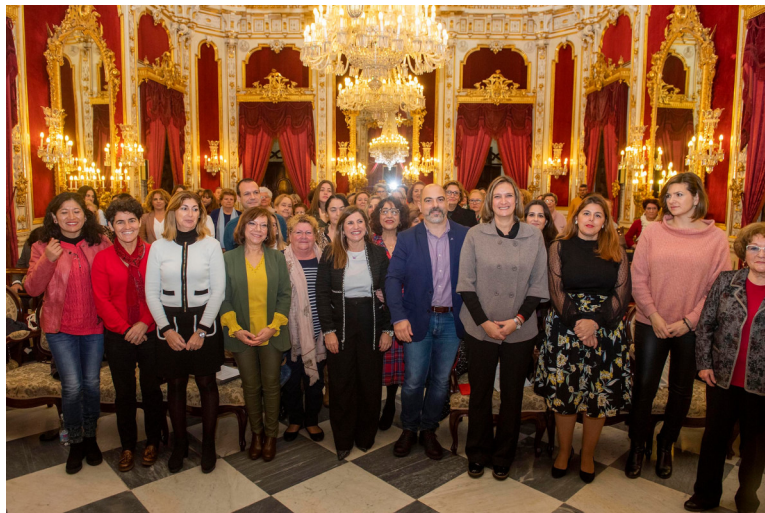
Fotografía de entidades premiadas y autoridades.