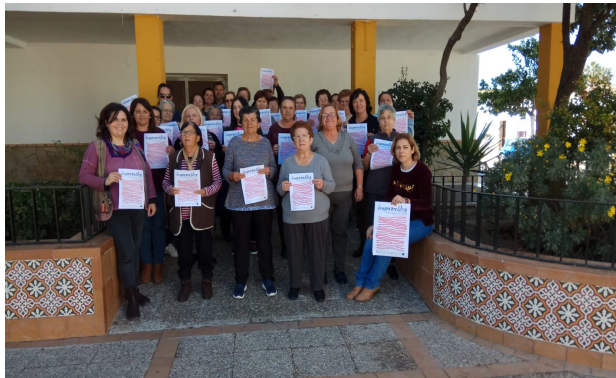
Concentración en Nueva Jarilla.