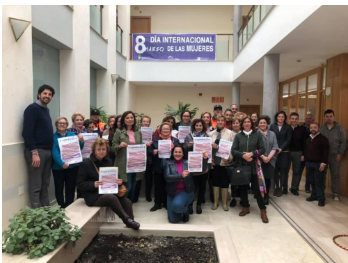
Concentración en San José del Valle.