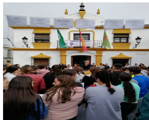
Concentración en Puerto Serrano.