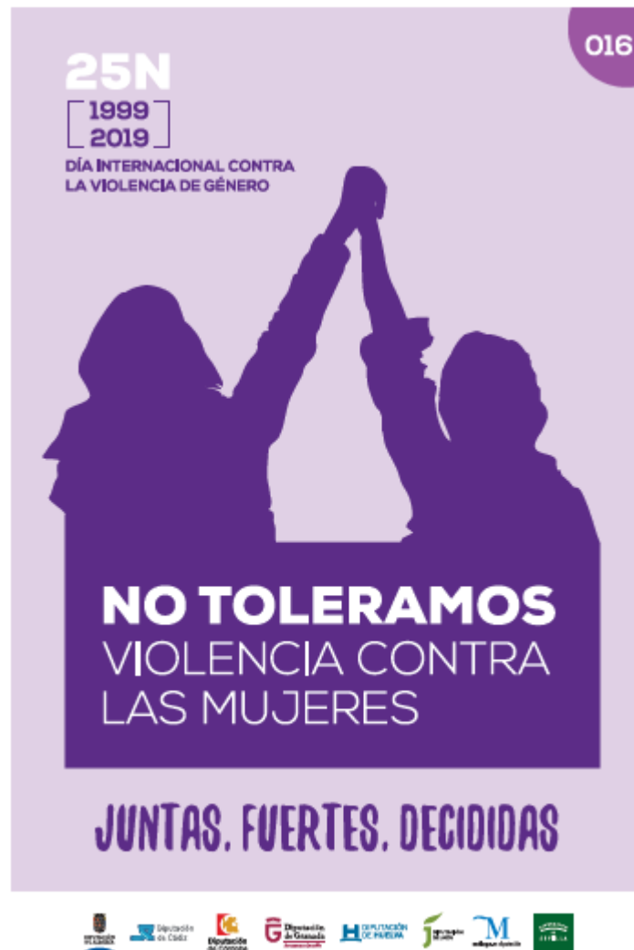
Cartel de la campaña.

Objetivo general: sensibilizar en materia de violencia contra las mujeres a la población de la provincia.