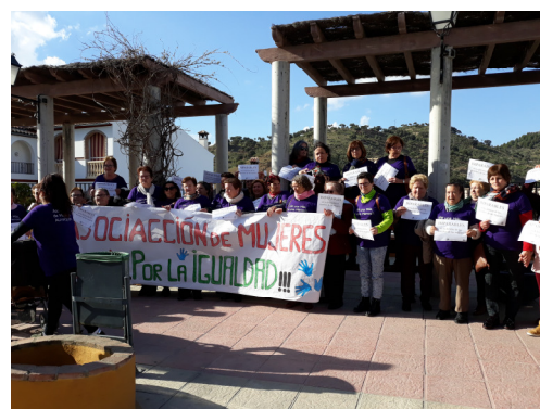
Concentración en Torre Alháquime.