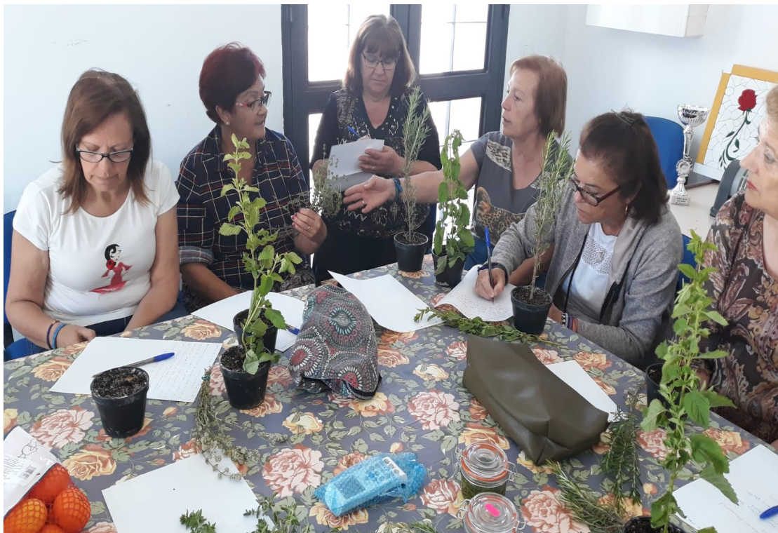
Taller en San Isidro del Guadalete.