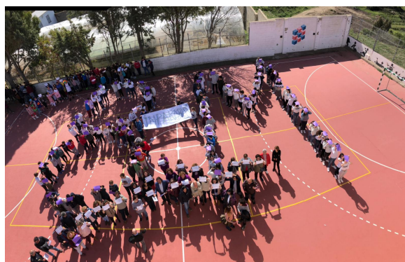
Concentración en Medina Sidonia.