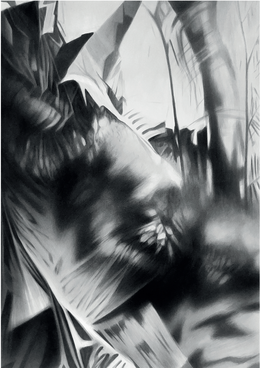
Detalle naturalista I / tinta china sobre papel / 100 x 80 cms. / 2021