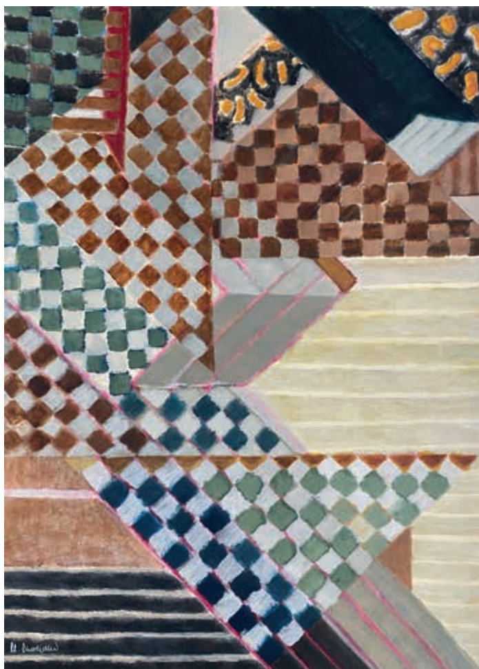
ALICATADO II • acrílico sobre papel, 70 x 50 cms., 2020

Desde la Fundación Provincial de Cultura entendemos nuestra Sala Rivadavia como una plataforma desde la que dar difusión y visibilidad al mejor arte actual, tanto de artistas de nuestra provincia como de fuera de ella, siempre que la calidad del trabajo mostrado, requisito indispensable para formar parte de nuestra programación, sea indudable y evidente. Son numerosas las ocasiones en las que nos alegramos de llevar hasta los paneles de este espacio expositivo la obra de artistas jóvenes, nuevas promesas que comienzan a dar sus primeros pasos en prometedoras carreras artísticas y que, esperamos, pueden convertirse en nombres propios del panorama artístico español en unos años. Y otras veces nos ocurre justamente lo contrario, nos gusta reconocer con una exposición el trabajo de grandes artistas, artistas de aquí que, con largas carreras llenas de éxitos, han llevado a gala el arte de nuestra tierra allá donde han tenido la oportunidad de mostrarlo.