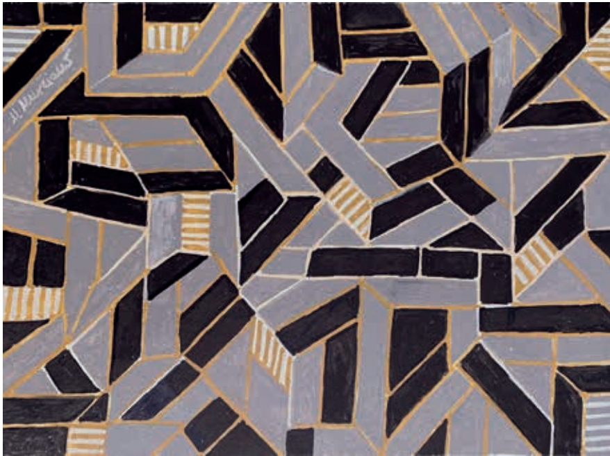
ESCALERAS · acrílico sobre papel, 21 x 30 cms., 2021 GRIS Y NEGRO · acrílico sobre papel, 21 x 39 cms., 2019