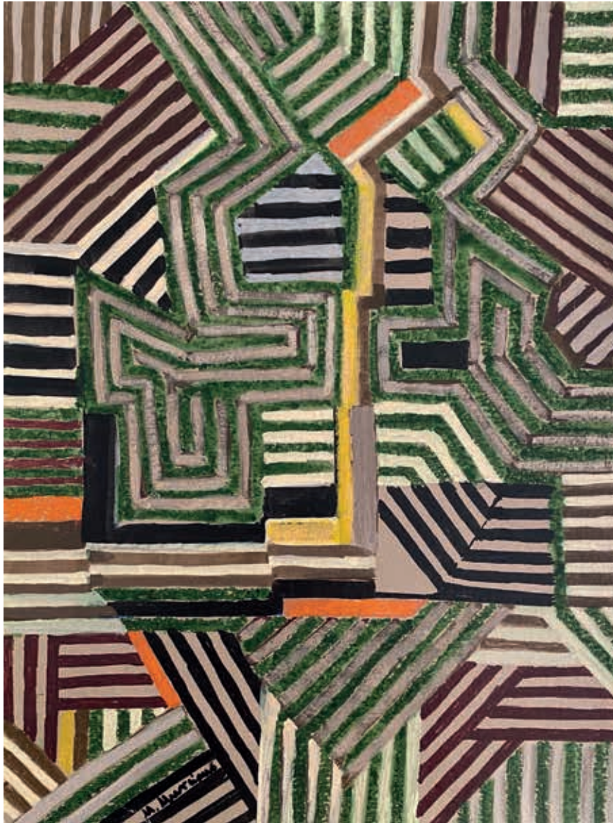
CAMINO AMARILLO · acrílico sobre papel, 30 x 21 cms., 2019

SIN TÍTULO · acrílico sobre papel, 50 x 70 cms., 2019