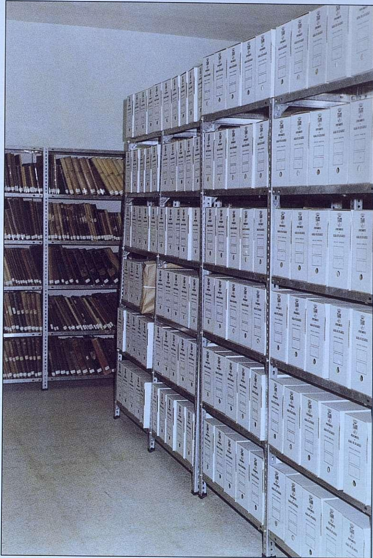
Archivo Municipal organizado.