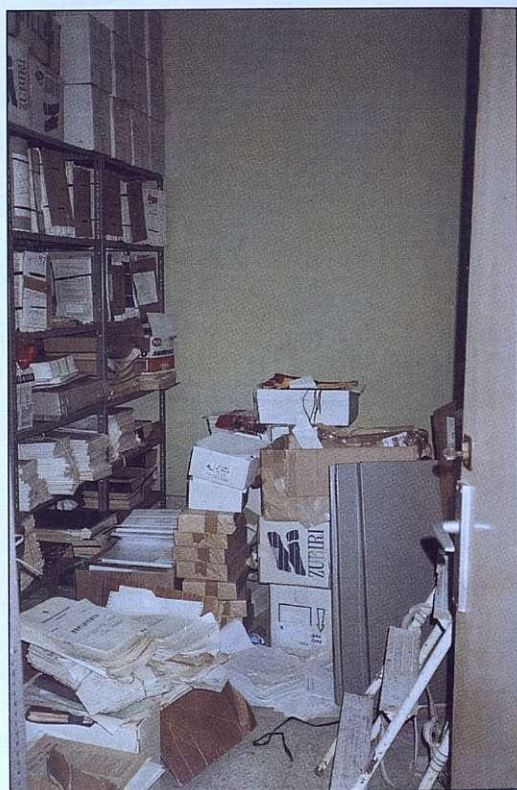
Estado del Archivo antes de su organización