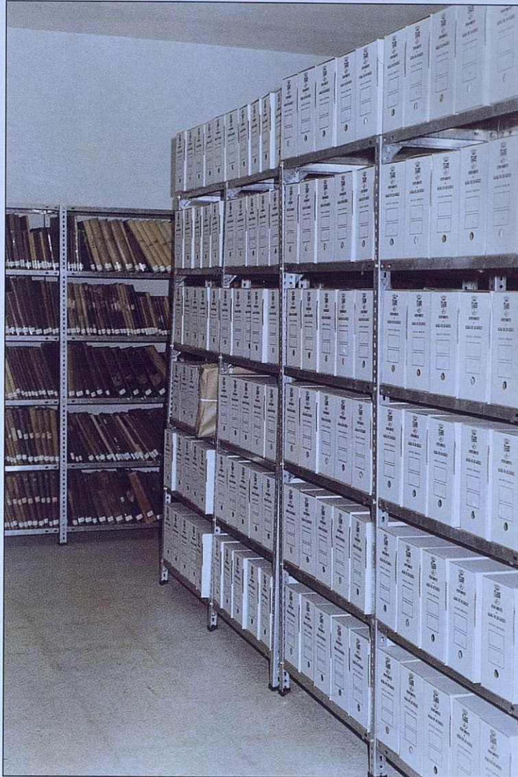
Archivo Municipal organizado.