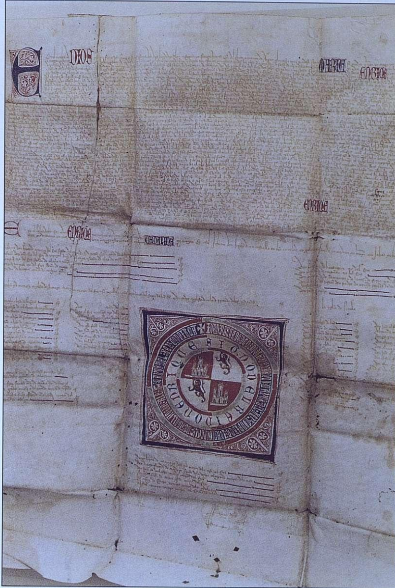
Privilegio Rodado 1390