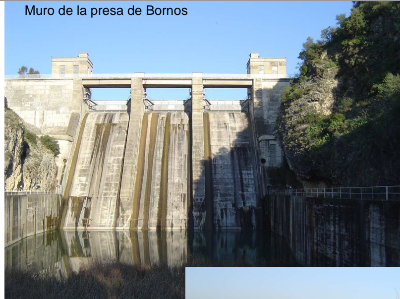
Muro de la presa de Bornos

La Presa cuenta con una pequeña central hidroeléctrica cuya producción se acerca a los 20 millones de Kw/h al año, mediante turbinas tipo Francis. El caudal empleado es de 15 m 3 /s. en un salto de agua de 39 m.