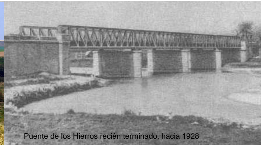
Puente de los Hierros recién terminado, hacia 1928